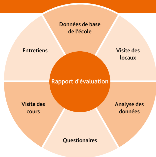
La méthode de l'évaluation externe

L'ORS (Cadre d'orientation pour la qualité dans les établissements scolaires) est la base essentielle pour l'évaluation externe. Il implique systématiquement des critères de qualité pour un bon enseignement et des établissements scolaires compétents en Rhénanie-Palatinat.