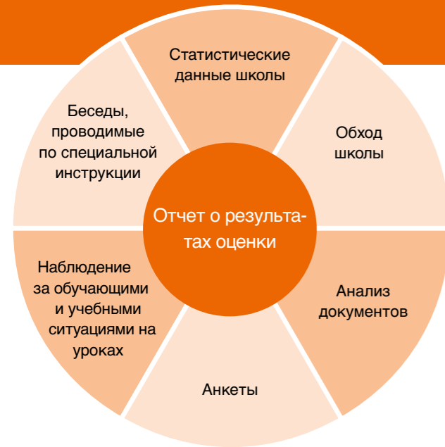
Методы внешней оценки

Важным базисом для проведения внешней оценки является документ «Orientierungsrahmen Schulqualität», в котором систематизированы критерии качества для хороших школ и хорошего преподавания в Райнланд-Пфальц. На эти критерии опирается также и AQS при оценке школ. В центре внимания при этом - качество преподавания и успеваемость учащихся.