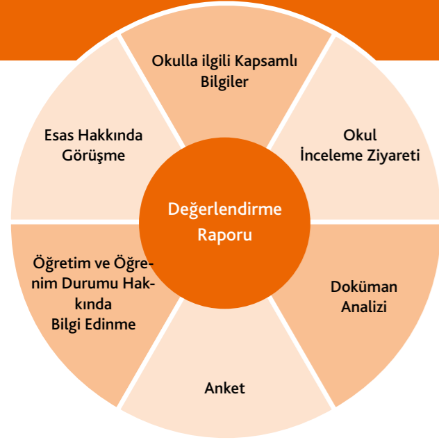
Harici Değerlendirme Metotları

Harici değerlendirmenin önemli temelini, Rheinland-Pfalz Eyaleti'nde, iyi bir okul ve iyi bir ders için kalite kriterlerinin sistemli bir şekilde tanımını yapan „Okul Kalite Yönlendirme Çerçevesi“ oluşturmaktadır.