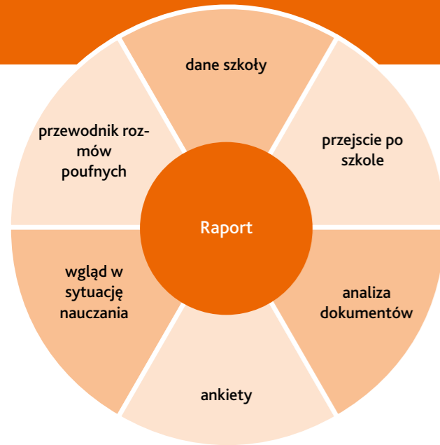
Metody ewaluacji zewnętrznej

Podstawą ewaluacji zewnętrznej są Ramy Orientacyjne Jakości Szkoły, które opisują systematycznie kryteria jakości dobrej szkoły i dobrej lekcji w Nadrenii Palatynacie.